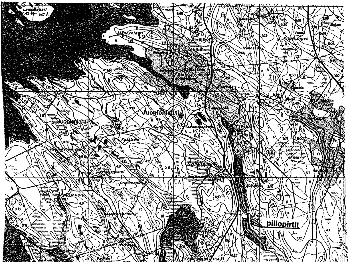
Kartta: Juonion piilopirttien sijainti, kopio maanmittauslaitoksen maastokartasta nro 324401

Vainolaisen lähestyessä vesitietä pitkin kohti Sotkanselkää, ihmiset ja karja on kuljetettu piilopirtille joko metsiä pitkin tai soudettu Juonion-järveä pitkin. Piilopirtillä on voitu viettää pitkiäkin aikoja, koska ympärillä on ollut viljelyksiä, erämaata metsästyksen ja Juonion järvestä on voitu kalastaa. Piilopirtit ovat tuohon aikaan olleet maatalon henkivakuutuksia.